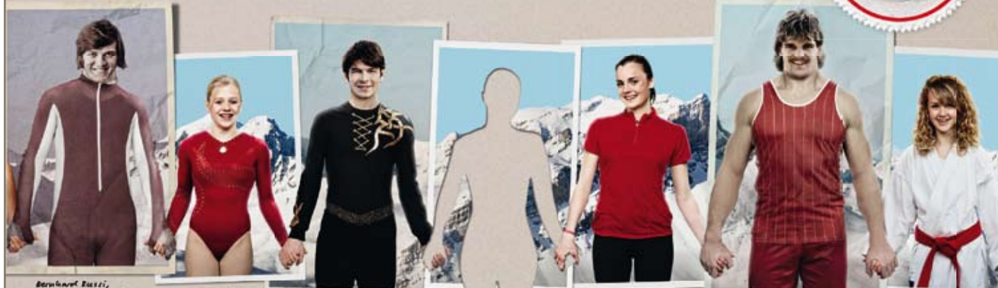
Bernhard Russi, Champion olympique et Champion du monde